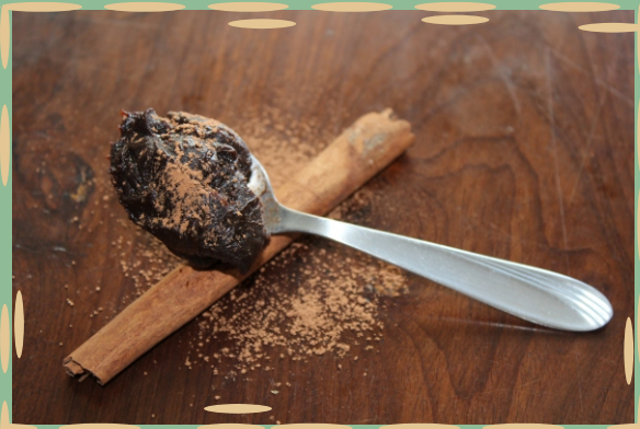
brigadeiro de colher