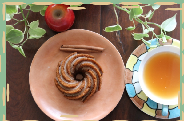
bolo de maçã com canela