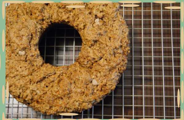
bolo de banana